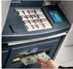
ATM - Automatic Teller Machine Máy rút tiền tự động