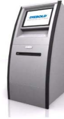
KIOSK Máy giao dịch phi tiền mặt