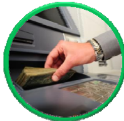
CDM - Forex Máy gửi/ rút tiền tự động