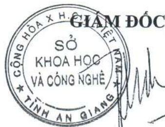
Tăng Phú An